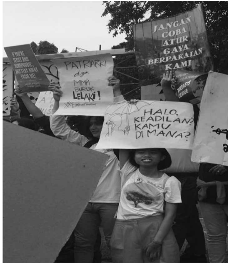
Gambar 2. Aksi Women's March 2018

Partisipasi dan Solidaritas: Kampanye, Aksi, dan Pameran Karya