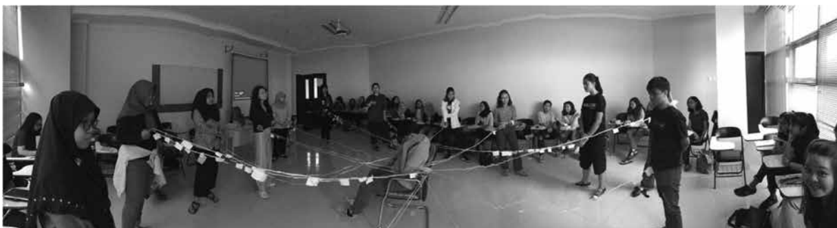
Gambar 1. Permainan Jaring Laba-Laba