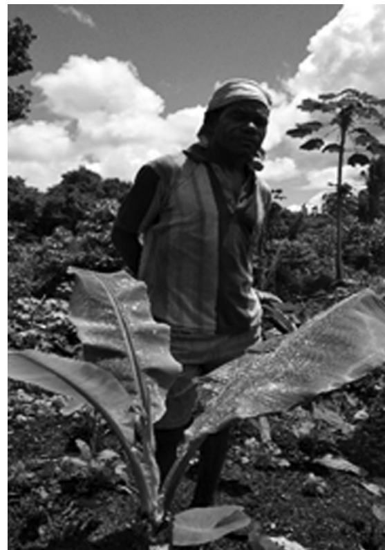
Gambar 1. Petani lokal menanam pohon pisang (tumbuhan jangka-panjang/musiman) di area pertanian komersial dan subsisten.

liar dan pakis di atasnya. Tumbuhnya hutan sekunder tentu saja mencegah luasnya erosi tanah dan ancaman banjir. Dari beberapa wawancara yang dilakukan, para petani kembali ke daerah awal perladangan, beragam antara lima hingga enam tahun. Periode penanaman pengosongan tanah selama tahun-tahun ini menyusul penanaman selanjutnya memungkinkan regenerasi hutan dan humus. Semakin petani membuka hutan primer, maka semakin lama ia akan kembali ke awal ia bertanam, dan semakin muncul luas hutan sekunder (King 2012). Namun pilihan yang paling logis bagi mereka adalah tetap berputar pada hutan sekunder, alasannya jika hutan primer telah dibuka dengan luas, maka jarak dengan rumah mereka akan semakin jauh dan sukar untuk mengontrol babi hutan yang kadang datang menyerang.