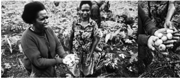
Gambar 2. Perempuan lokal memegang tomat lokal dari benih yang disimpan

Saya kalo bikin tomat "Jawa" berarti bikin pertanian tadi. Kita harus bikin pertanian sudah. Kalo tanam sembarang dia tidak bagus, tanam, terawat, teratur, baru dia ada hasil. Tanam sembarang kalo lokal ini, sembarang.