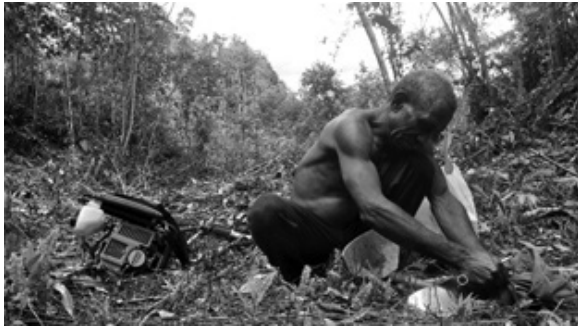
Gambar 4. Petani lokal Papua laki-laki menggunakan mesin pancabut rumput pada pertanian campuran tradisional ke modern.

Ketika peladang berpindah mulai menetap, seperti beberapa contoh kasus yang ditemukan di Kabupaten Sorong, perempuan mulai kehilangan kontribusinya di bidang perawatan tanaman. Hal ini terjadi ketika suami mereka mulai menggunakan pupuk, pestisida dan herbisida kimiawi. Semenjak petani menggunakan herbisida kimiawi, peranan perempuan dalam mencabut rumput juga berkurang. Alasannya, mereka enggan untuk mencabut rumput yang telah disemprot bahan kimia sebelumnya. Demikian juga dengan teknologi mesin pemotong rumput, traktor tangan yang semuanya digunakan oleh laki-laki.