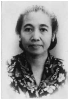
Gambar 5. Nyi Sri Sulandari Mangunsarkoro (Tokoh Pergerakan Wanita)