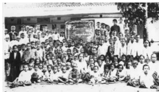
Gambar 1. Ki dan Nyi Hajar Dewantara di antara pamong dan siswa Taman Siswa Jl. Tanjung, Yogyakarta, 1925.

Konstruksi tersebut terus direproduksi dalam ajaran-ajaran yang diberikan di Tamansiswa, baik di sekolah maupun asrama. Kebijakan-kebijakan yang dikeluarkan dalam Tamansiswa bahkan tidak bisa lepas dari konstruksi tersebut. Ki Hajar bahkan dengan aktif menulis dan menjawab pertanyaan di Wasita dan Poesara untuk menjelaskan yang boleh dan tidak boleh dilakukan oleh para anggota perempuannya (Majelis Luhur Persatuan Tamansiswa 2013, hh. 245-247)