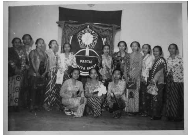
Gambar 7. Pengurus Partai Wanita Rakyat cabang Yogyakarta 1954