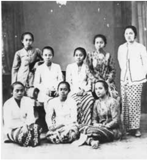
Gambar 6. Pengurus Wanita Taman Siswa Yang Pertama. Belakang (searah jarum jam):

tersebut, ia juga merumuskan rancangan panduan bagi Wanita Tamansiswa yang kemudian disebut dengan "Peraturan Besar Wanita Tamansiswa".