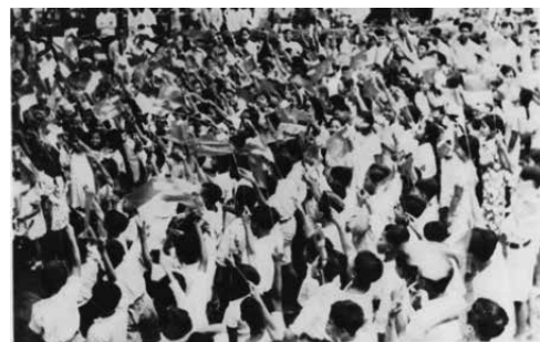
Gambar 3. Ki dan Nyi Hajar Dewantara. Dengan kegembiraan serta kelegaan dari siswa-siswa Taman Siswa Pematang Siantar menyambut kehadiran Ki dan Nyi Hajar. Suasana gempar dan gembira para siswa menyambut kedatangan beliau.

Di Tamansiswa sendiri, Nyi Hajar banyak menyumbangkan ide dan tenaganya, terutama saat Ki Hajar Dewantara bergabung dalam PUTERA (Pusat Tenaga Rakyat) tahun 1943 dan banyak berkegiatan di Jakarta. Nyi Hajar Dewantaralah yang kemudian menggantikan posisinya di Tamansiswa (Suratmin & Sutjiatiningih 1991, hh. 77-78). Ia duduk dalam Majelis Luhur, memimpin Tamansiswa untuk bertahan dari tekanan Jepang. Ia berusaha keras menghindarkan Tamansiswa dari propaganda Jepang dalam sekolah-sekolah (Dewantara 1979, h. 118).