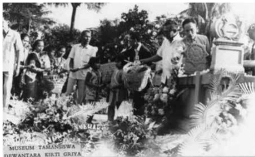
Gambar 4. Penghormatan/penaburan bunga pada makam Ny Hajar Dewantara oleh para pelayat/keluarga. Nyi Hajar Dewantara wafat 16 April 1971.

Kondisi kesehatan Nyi Hajar pun semakin memburuk. Ia kemudian wafat pada 16 April 1971. Jenazahnya dimakamkan di Taman Makam Wijayabrata, Yogyakarta (Majelis Luhur Persatuan Tamansiswa 1996, h. 55, h. 65). Hal yang dilakukan oleh Nyi Hajar Dewantara dalam dunia pergerakan tidak bisa lepas dari latar belakangnya sebagai keturunan priayi Pakualaman. Berpegang pada ajaran leluhurnya, ia mampu menjalankan perannya sebagai pemangku keturunan . Dari rahim pendidikannya, ia mampu menjadi ibu, seorang Sumbadra yang berhasil merumuskan pemikirannya dan melahirkan para "ibu bangsa".