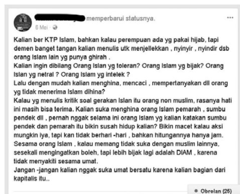
Gambar 1. Status Buzzer Seputar Pilgub Jakarta 2017

Dalam konteks Pilgub Jakarta 2017, politisasi yang terjadi dalam kerangka kerja ibuisme Islam politik dapat berupa aktivitas pemilihan ( electoral activity ) dan aktivitas organisasi ( organizational activity ). Pada aktivitas pemilu, perempuan dapat menjadi sukarelawan dalam kegiatan kampanye dan mengajak untuk memilih ataupun tidak memilih kandidat tertentu. Hal ini mewujud dalam perbincangan sehari-hari dan media sosial. Sebagai contoh status facebook salah satu pendengung ( buzzer ) berinisial NS yang berisi pernyataan yang ditujukan untuk membungkam suara kritik dari sesama perempuan muslim. Hal ini tampak pada gambar berikut.