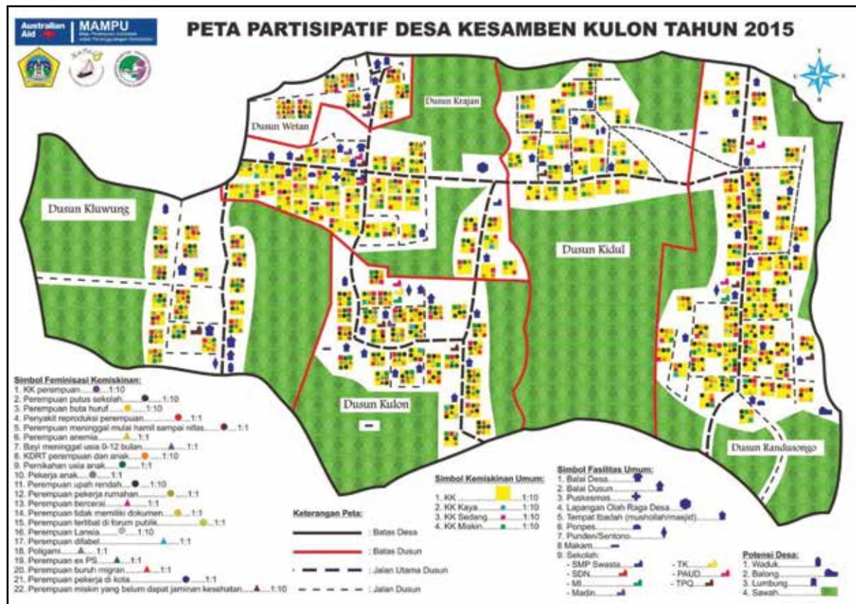
Gambar 1. Peta Partisipatif Desa yang diadopsi dalam profil desa Kesamben Kulon